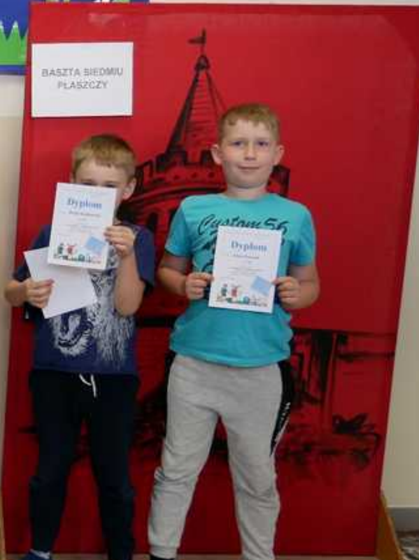
BASZTA SIĘDMU PŁASZCZY