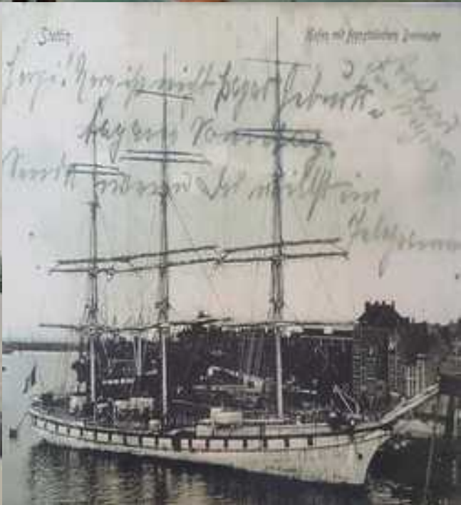
Stettin Kafen mit Kaffeebohnen