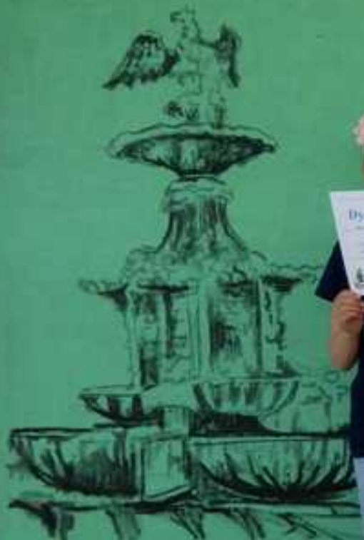
FONTANNA ORLA BIAŁEGO