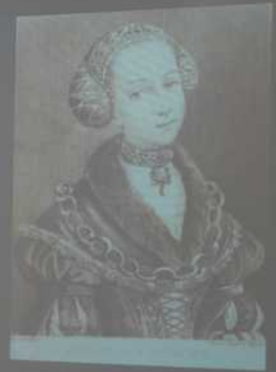
Sydonia von Borck