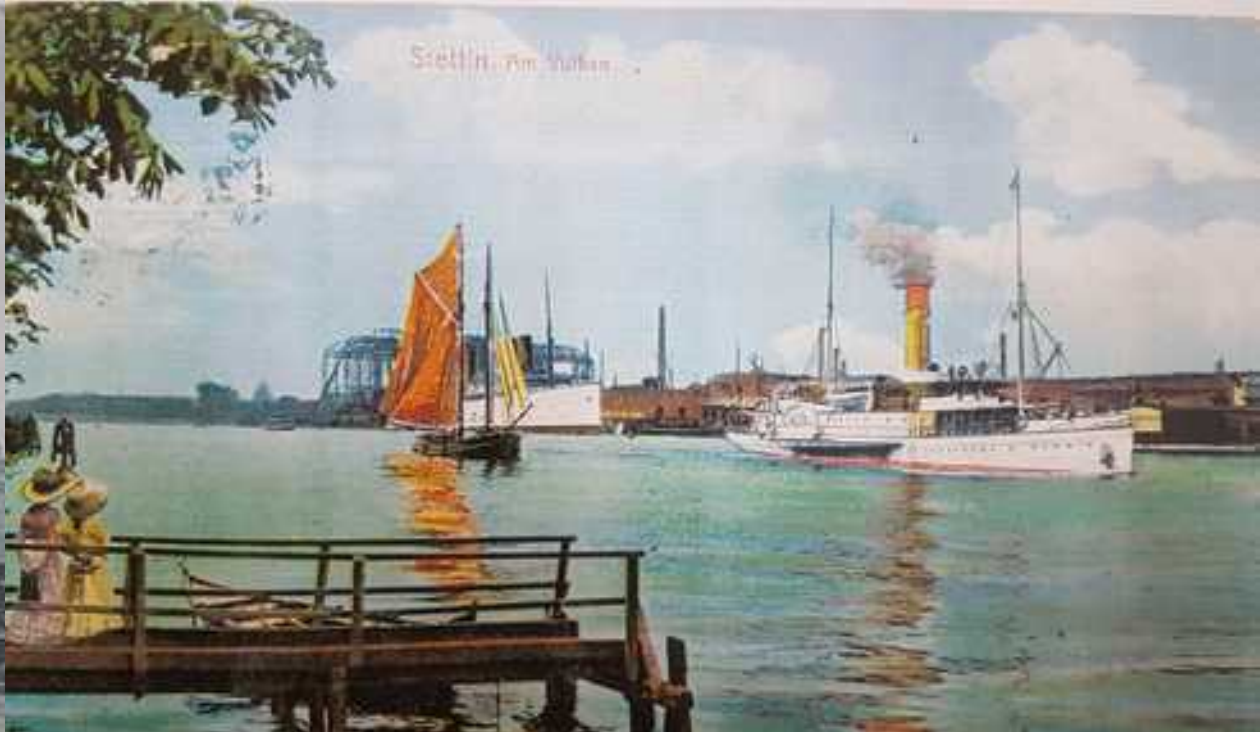
Stettin, Am Vulkan