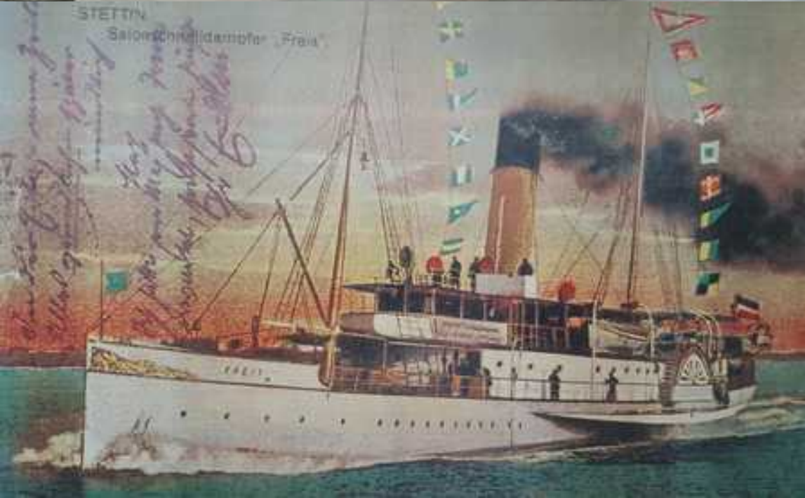
STETTIN Saison-Schnelldampfer 'Freia'